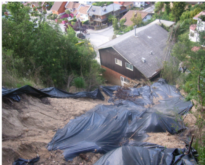
Figura 2: Deslizamiento de tierra sobre una casa. Este deslizamiento acarreo además del suelo y barro, árboles y rocas.

del efecto de estas intervenciones podemos mencionar la pérdida total de la mitad de la losa del pavimento de Calle Nueva.